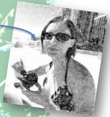
Einen Muffin am Strand genießen