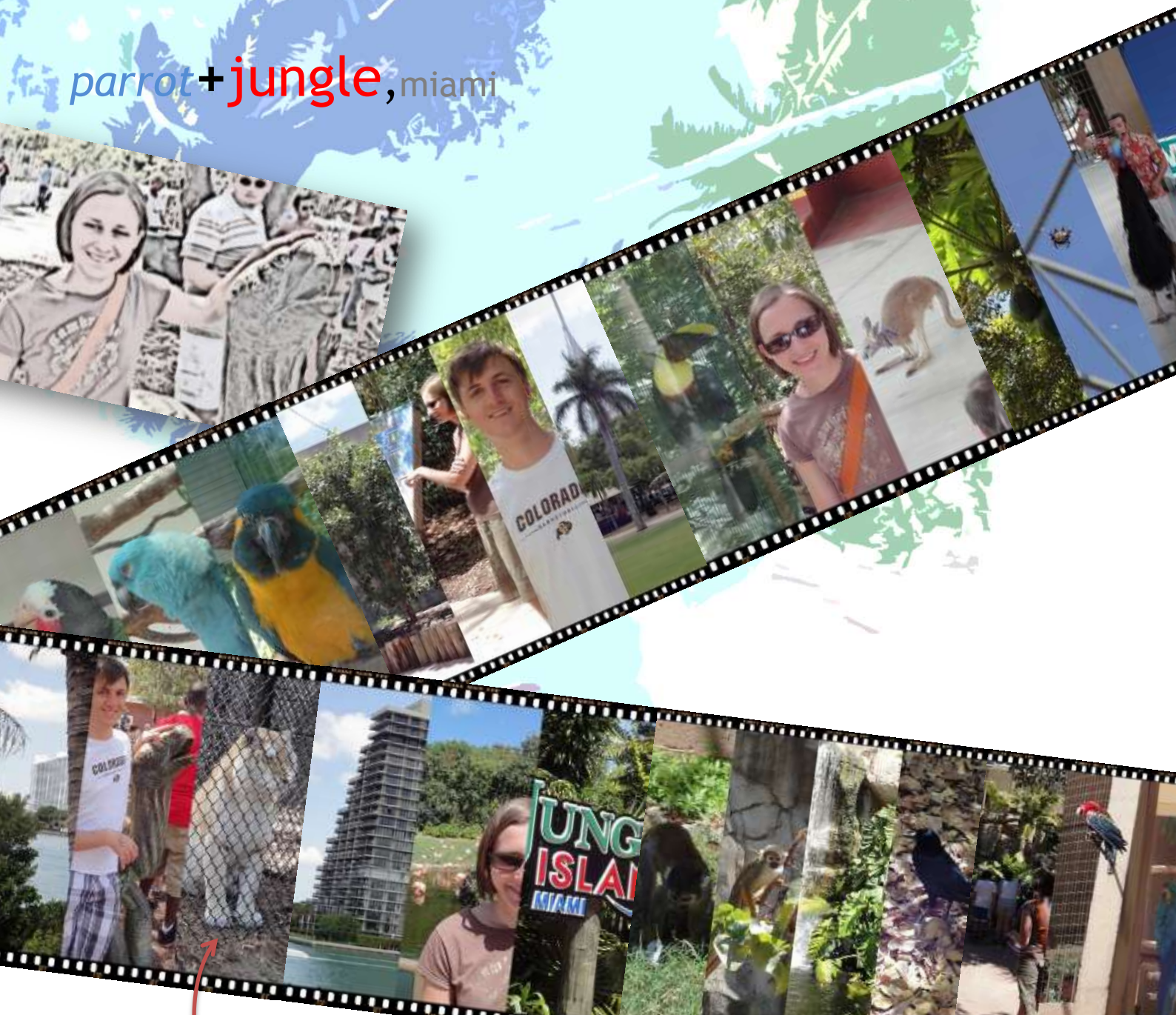
Dieses Tier soll einen Liger (Lion + Tiger) darstellen. Meine Vermutung ist aber, dass es sich um einen rasierten Löwen auf amerikanischer Diät handelt.