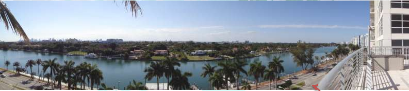
Blick vom Hotelzimmer aus auf den angrenzenden Kanal und die Villen auf der anderen Seite