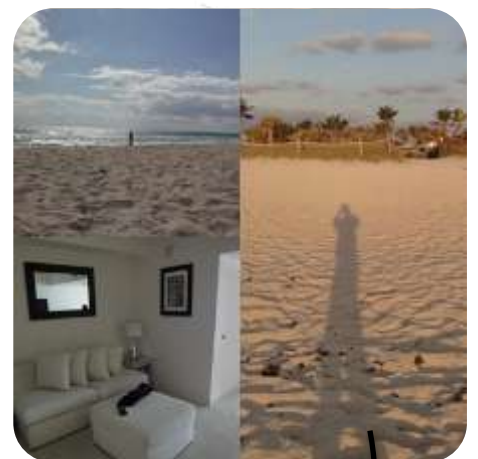
Schattenspiel im Abendlicht