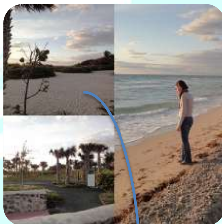
Park in der Nähe der Lincoln Rd